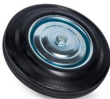
Рисунок 1. Колесо резиновая покрышка.